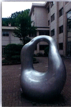
『揺籃』中庭にあるモニュメント(P6 参照) 「時の流れと時代のうねりを根底として生きる人々の平和と安らぎを求める心をしっかりと受け止めて育み、揺籃のぬくもりとやさしさを表現(諏訪二葉高校ホームページより)」

日時:11 月 27 日(日) 午前 9 時～12 時 会場:主婦会館プラザエフ 四ツ谷駅麹町口徒歩 1 分 東京都千代田区六番町 15 電話 03-3265-8111 会費:2,000 円(昼食代含む) 内容:一 平成 28 年度定期総会報告 二 平成 28 年度支部活動について 三 平成 29 年度に向けて ・同窓会に関するアンケート結果 ・維持費についての提案など