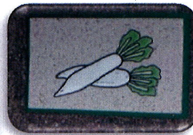
『大根のプレート』 大根坂の路肩に設置されている大根のプレート。3 年間通うと大根足になると言われた大根坂が、今では固有名詞!?可愛らしい絵に癒されます。