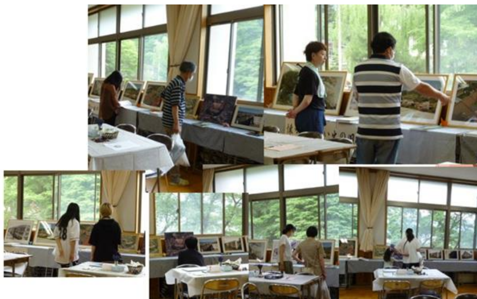
同窓会の展示を興味深く見学していただきました