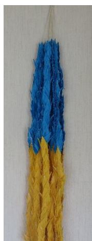
折っていただいた折り鶴 (ウクライナの国旗色)