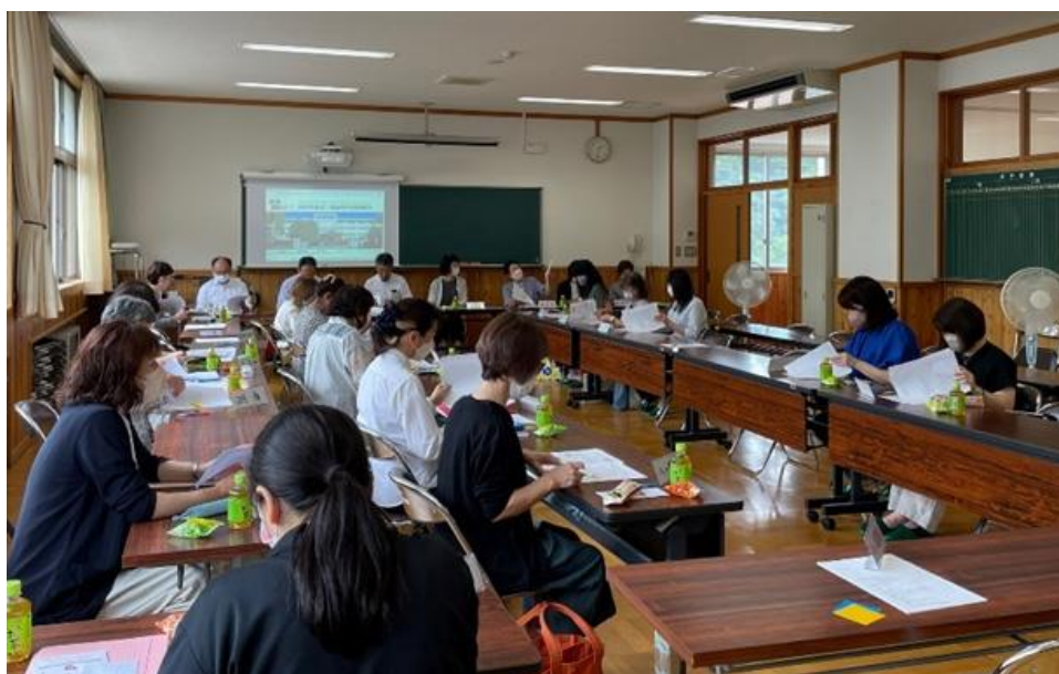
暑い中熱心に協議していただきました

その後、会長より、活動報告として、二葉祭で行った「明治のピアノと奏でるロビーコンサート」の様子や、「同窓会コーナー・休憩室」で“平和”をテーマに、戦争の時代に二葉高校が歩んだ歴史を展示して紹介し、来室者に平和への思いを折り鶴に込めて折っていただいた様子を、映像を通して報告いたしました。