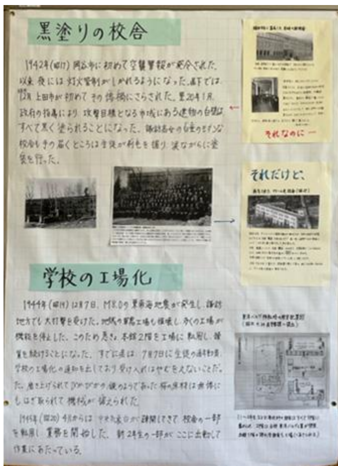
戦時中の二葉高校